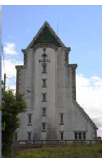
Phare du Bodic

Lundi 5 juillet - Appareillage vers 9h30. A la sortie du chenal, le vent de 8 Nds nous oblige à contourner au moteur la Presqu'île Sauvage de Lézardrieux et son Sillon de Talbert. Passé les Héaux de Bréhat, direction le chenal de la Moisie avant de suivre le balisage dans le petit fleuve du Trieux pour arriver au port de plaisance de