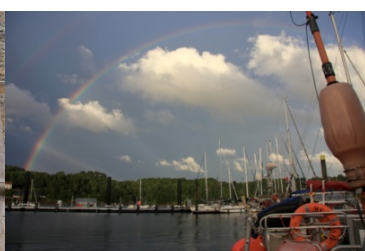
Après la pluie