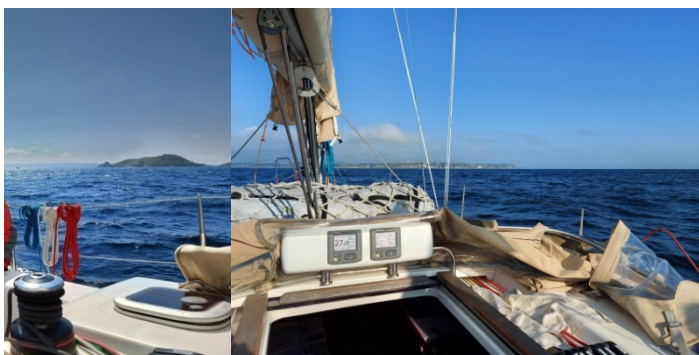
On arbore nos couleurs dans les eaux anglaises !

l'adresse d'un bijoutier-verrier. Contacté, il nous accueille chez lui, dans son nouvel atelier encore en construction, et nous montre ses dernières créations de mini-galaxies en verre. Tentant ! Durant tout l'après-midi, nous arpentons les ruelles de Bréhat, du sud au nord. Le moulin à marée, la Chapelle Saint-Michel, la Corderie, l'amer du Rosedo et partout des agapanthes bleues. Le ciel se noircit. Juste le temps de rentrer au bateau avant la pluie. Encore un bel arc-en-ciel !