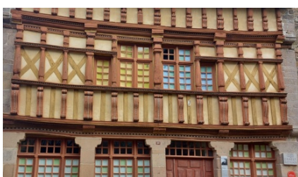
Tréguier - Maison Ernest Renan

Compte tenu des courants, départ prévu dimanche matin pour naviguer vers l'est. Quelques belles escales nous attendent sur cette côte bretonne rocheuse et découpée. Pour la météo, on s'adaptera !