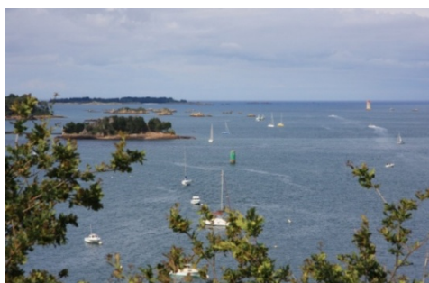
Le Trieux - Panorama sur la baie

Un avis de grand frais à fort coup de vent est annoncé pour lundi soir et mardi. Lézardrieux, port situé dans l'estuaire du Trieux voisin, sera un bon abri.